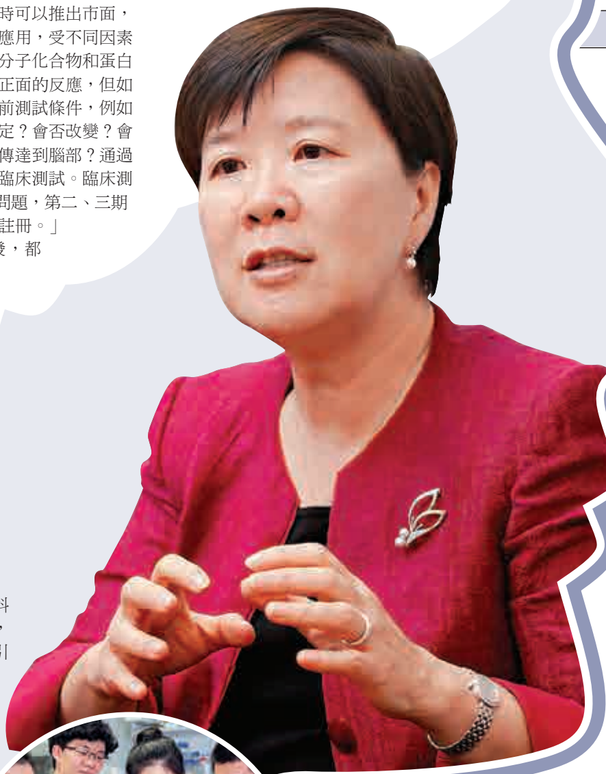
▲葉玉如是首名獲得世界傑出女科學家成就獎的港產科學家

葉玉如強調，希望大眾明白，科研是帶動經濟的重要元素，如果現在香港社會有能力在研發做得更好，就好應該把握機會，最重要是各方面好好合作，不可以自己閉門造車，要連結不同的機構合作。當社會讓學生感受到有前景，自然會更有興趣投身科研工作。